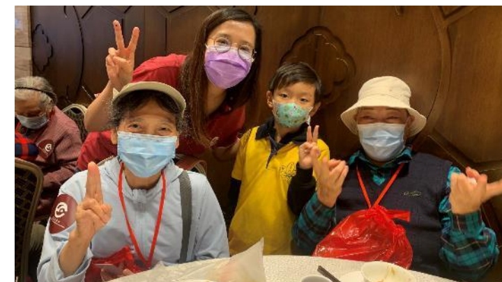
「有福同港·有義同遊」長者項目 (45+人)