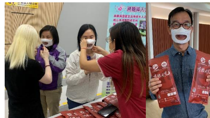
「讀唇友善」醫用口罩 (90,000個)