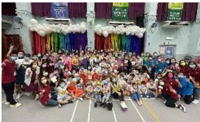
「小題大做」劏房兒童師友計劃 (600+人次)