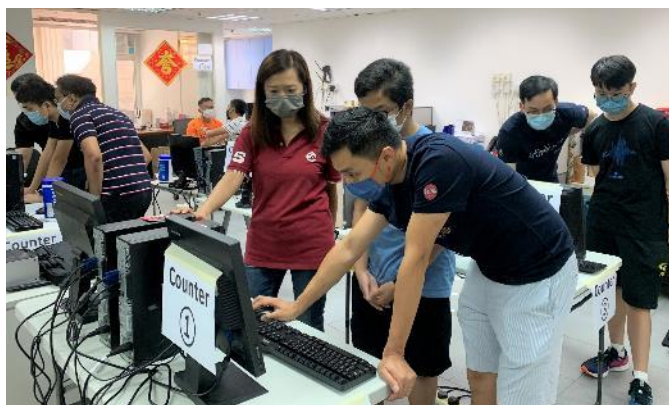
小題大做 x 電腦捐贈計劃 (245部)