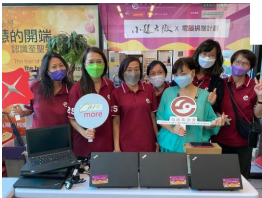
小題大做 x 電腦捐贈 (~500部)