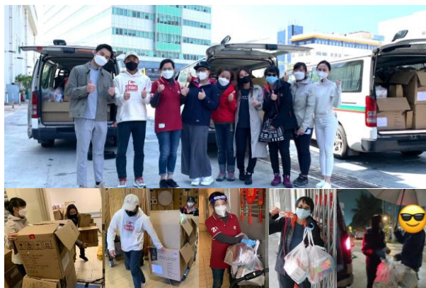
東張西望/爭分奪秒同抗疫 (821家庭)