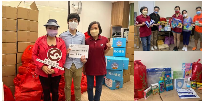
「食德是福」愛心禮包 (600家庭)