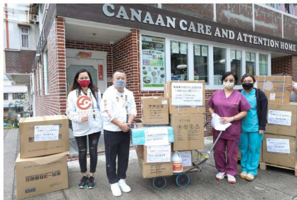
舍福仁人 (240院舍 & 145校舍)