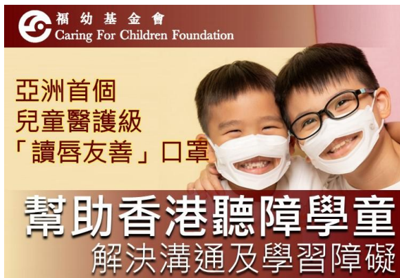
兒童「讀唇友善」口罩 (28,000pcs)