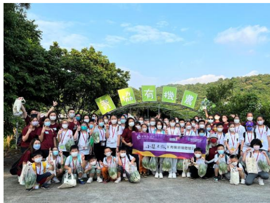
「小題大做」割房兒童師友計劃 (~560人次)