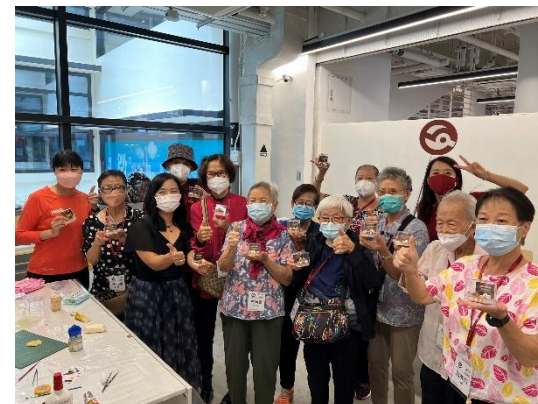
「有義同遊」長者項目 (~70人次)